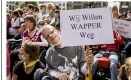
Eerder protesteerden de leerlingen tegen de Lange Wapperbrug. Nu verhuizen ze.

Dienstverleningscentrum (DVC) Sint-Jozef verhuist naar de Rozemaai in Ekeren. Sint-Jozef omvat een school voor lager en secundair buitengewoon onderwijs voor driehonderd leerlingen met een ernstige beperking en/of een zware medische problematiek. De toekomst van Sint-Jozef was een symbooldossier geworden. In 2008 werd er actie gevoerd nadat was gebleken dat de instelling pal onder de toen geplande Lange Wapperbrug zou liggen. Omdat Sint-Jozef ook bij de geplande Oosterweelverbinding er te lijden zou hebben onder de werken, konnt er in de Ekerse wijk Rozemaai een nieuwbouw, gefinancierd door de instelling zelf, de stad Antwerpen, nv BAM en de Vlaamse Overheid. De totale kosten worden geraamd op 32 miljoen euro. (jas)